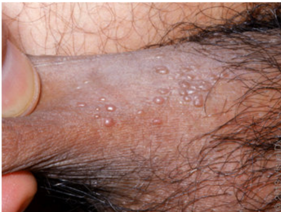
Hình 1. SMG dạng sẩn nhỏ ở thân dương vật