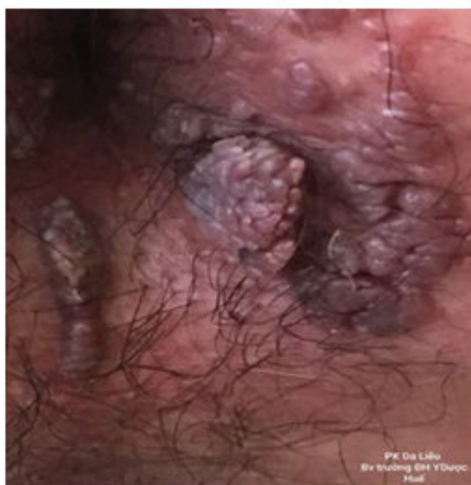
Hình 2. SMG dạng súp lơ ở rìa hậu môn

Một số thương tổn da thường ít gây cảm giác không thoải mái cho bệnh nhân. Đa phần là tìm ra tình cờ. Số ít bệnh nhân